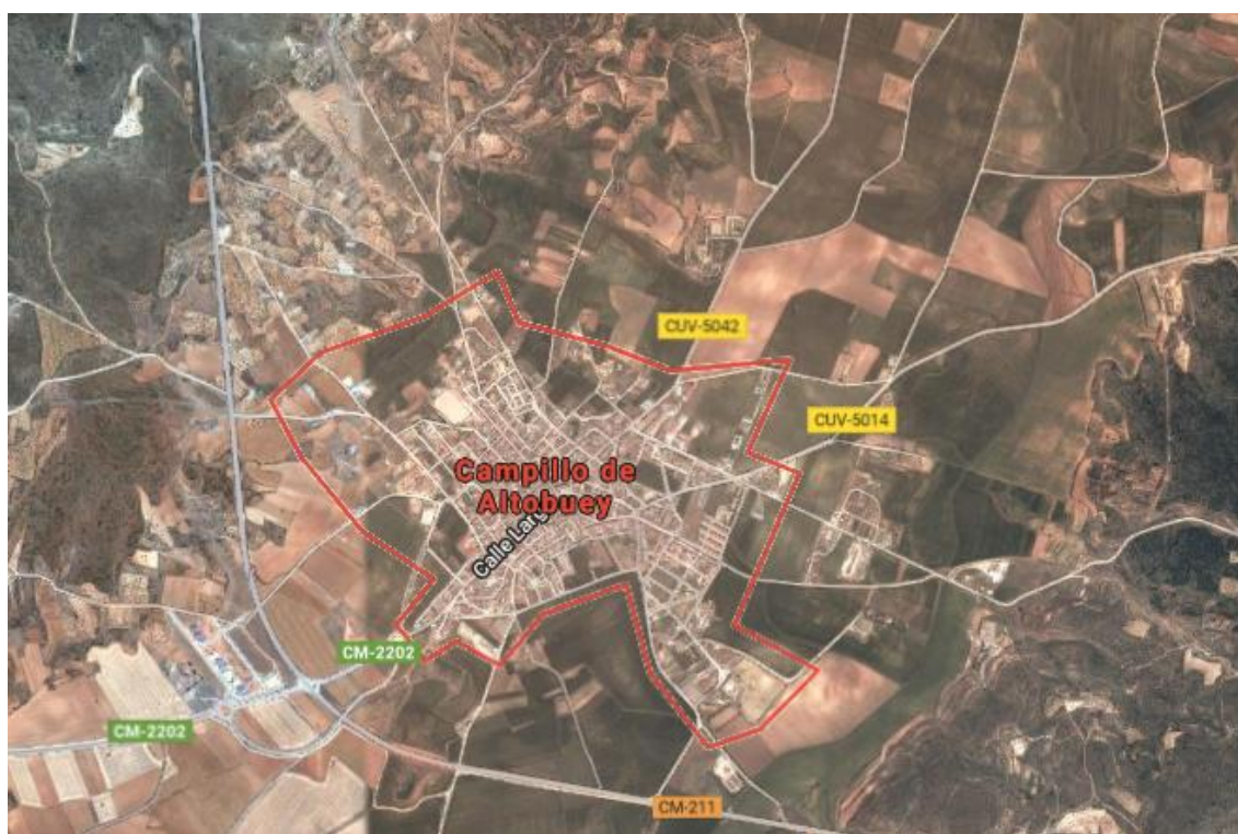
IMAGEN GRÁFICA Y TOPOGRÁFICA