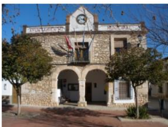
IMAGEN GRÁFICA Y TOPOGRÁFICA