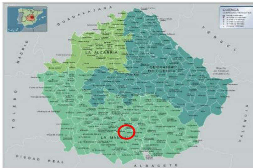
Mapa de Comarcas por Municipios de la Provincia de Cuenca

El Término Municipal de Atalaya del Cañavate se sitúa en el centro de la comarca, aproximadamente en el sur de la provincia de Cuenca, pertenece a la comarca denominada “La Mancha”.