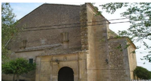
Iglesia Nuestra Señora de la Asunción