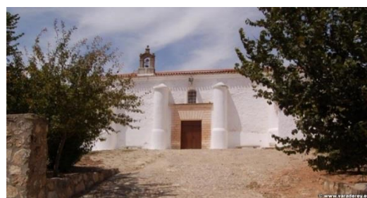
Ermita del Rosario