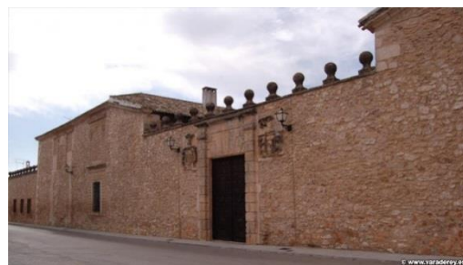
Palacio del Marqués de Valdeguerrero