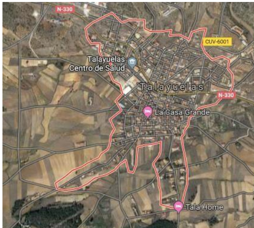
IMAGEN GRÁFICA Y TOPOGRÁFICA