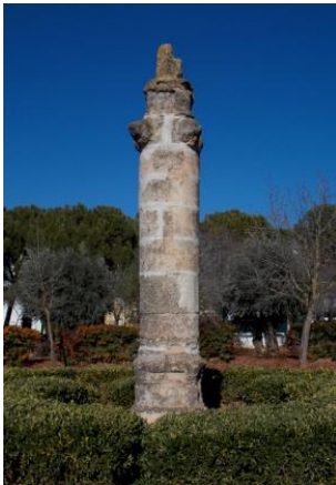
IMAGEN ESPACIOS PRINCIPALES