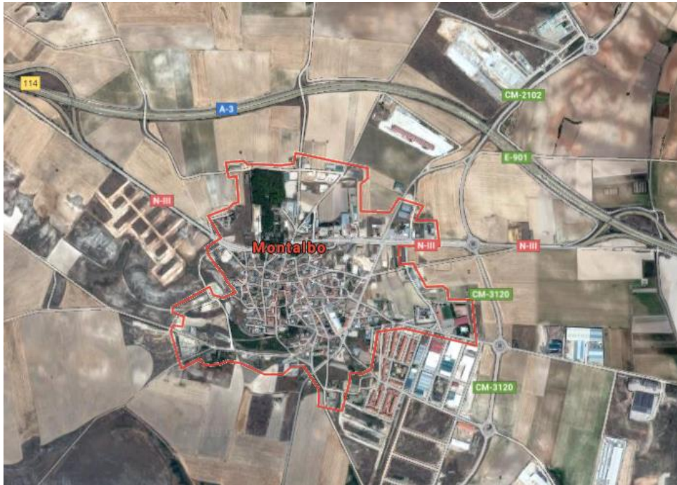
IMAGEN GRÁFICA Y TOPOGRÁFICA